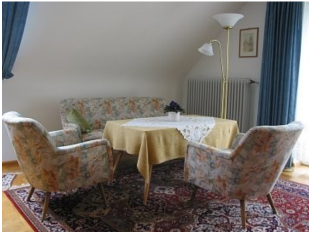
Wohnecke im großen Schlafzimmer

TV, Radio, Kinderbett, Hochstuhl, Garten, Schaukel, Sandkasten, Kinderspielgeräte, 2 Parkplätze, Fahrrad-Aufbewahrung im Haus